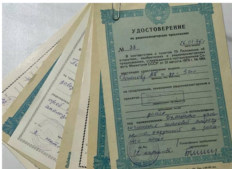
Рис.4. Удостоверения на рационализаторские предложения.