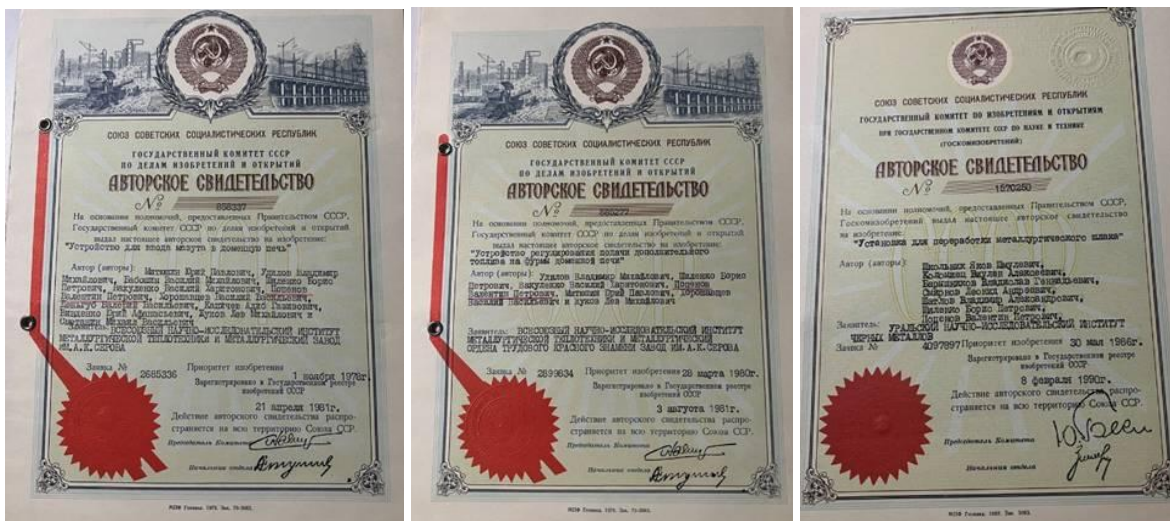
Рис.3. Авторские свидетельства на изобретения по усовершенствованию доменного производства.